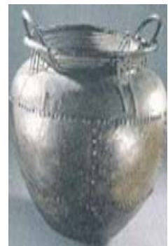
3. Calderó de bronze