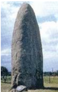
1. Menhir: monument megalític

A.1. OBSERVA AQUESTES TRES IMATGES I DIGUES A QUINA ETAPA DE LA PREHISTÒRIA PERTANYEN. EXPLICA TAMBÉ COM ERA LA VIDA DELS ÉSSERS HUMANS EN CADASCUNA D'AQUESTES ETAPES.