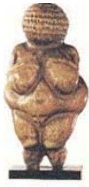
2. Venus de la fertilitat