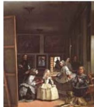
Las Meninas: Velázquez