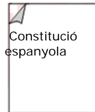
Constitució espanyola: Joan Carles I