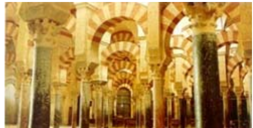
Mesquita de Còrdova