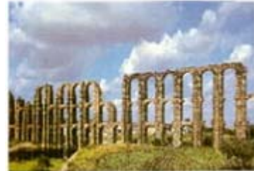
Aqüeducte dels Miracles, Elx